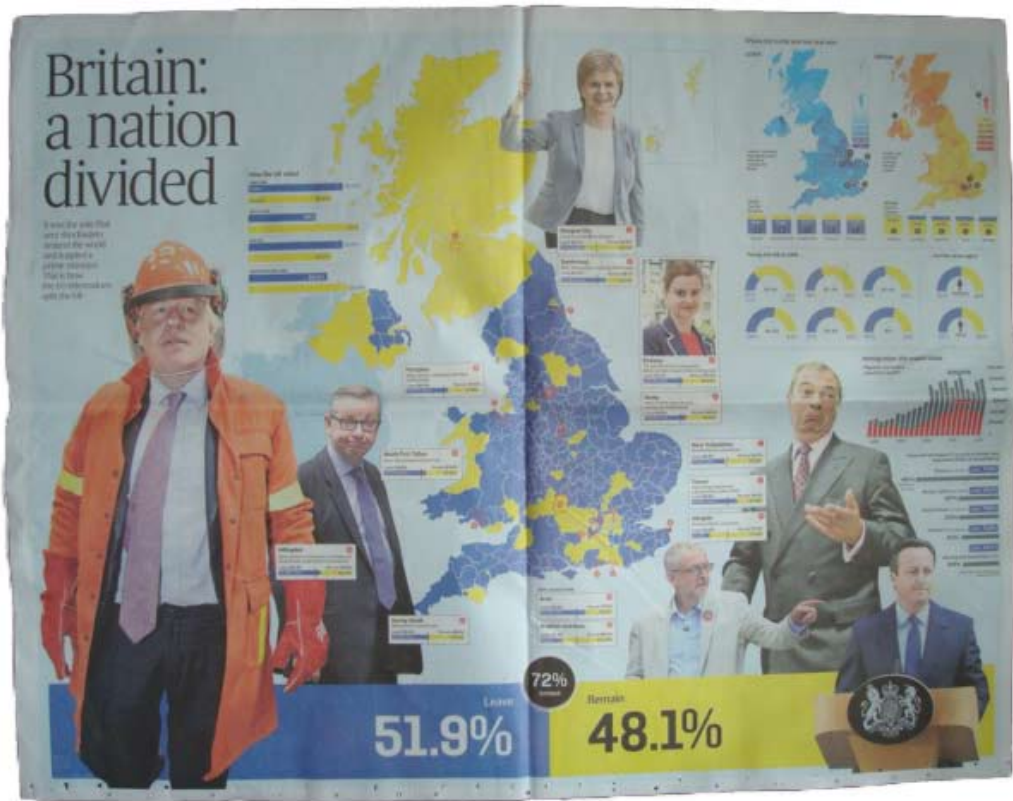
Sunday Times, dimanche 26 juin 2016. Pages intérieures du supplément « After Brexit, what now? »